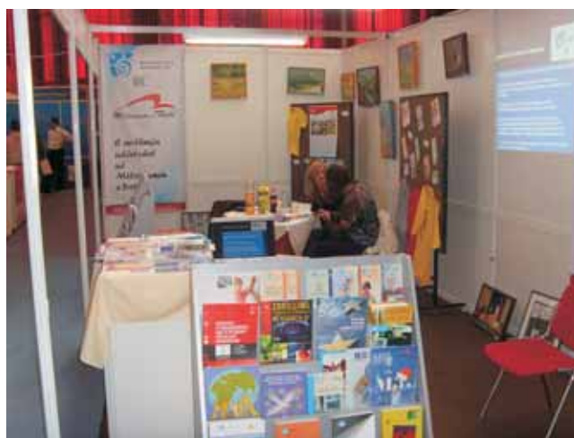
Foto nga aktivite të ndryshme